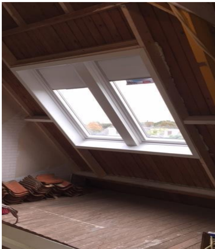
2 gekoppelde dakramen, haakse aftimmering