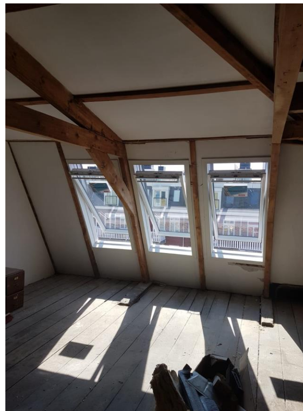
3 gekoppelde dakramen