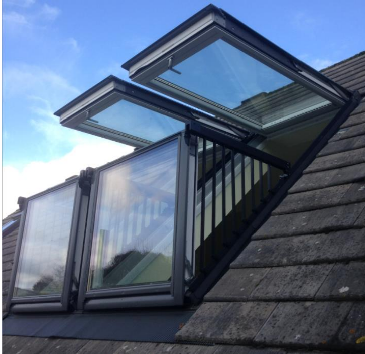
Cabrio duo Balkonvenster